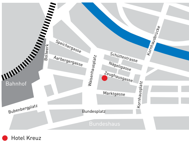
● Hotel Kreuz